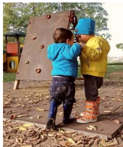
Scuola infanzia e nido San Giuseppe