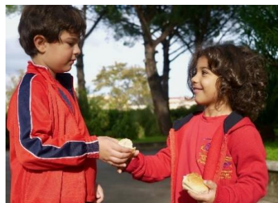
Scuola "Suore Francescane Alcantarine"