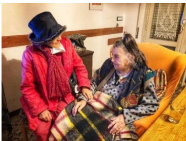
Liceo Morando Morandi Finale Emilia

Per maggiori informazioni e per visualizzare il regolamento completo, visita la pagina Contest su givingtuesday.it .