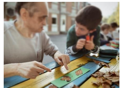
Scuola Santa Dorotea